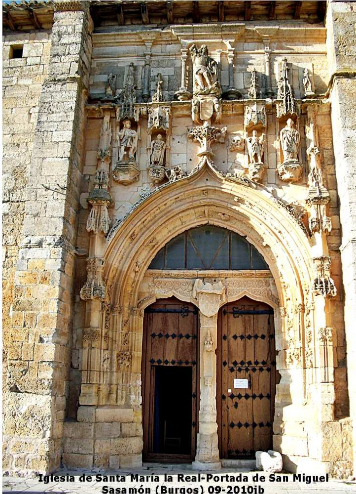
Iglesia de Santa María la Real-Portada de San Miguel Sasamón (Burgos) 09-2010jb