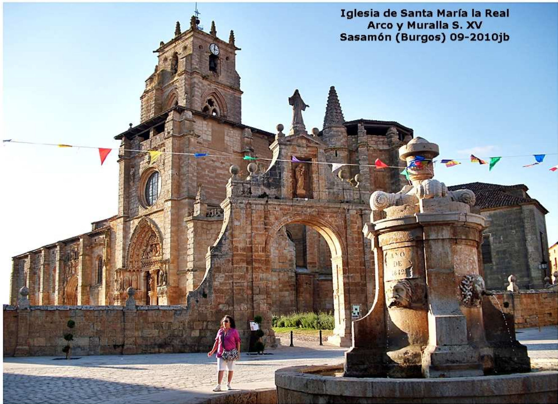
Iglesia de Santa María la Real Arco y Muralla S. XV Sasamón (Burgos) 09-2010jb