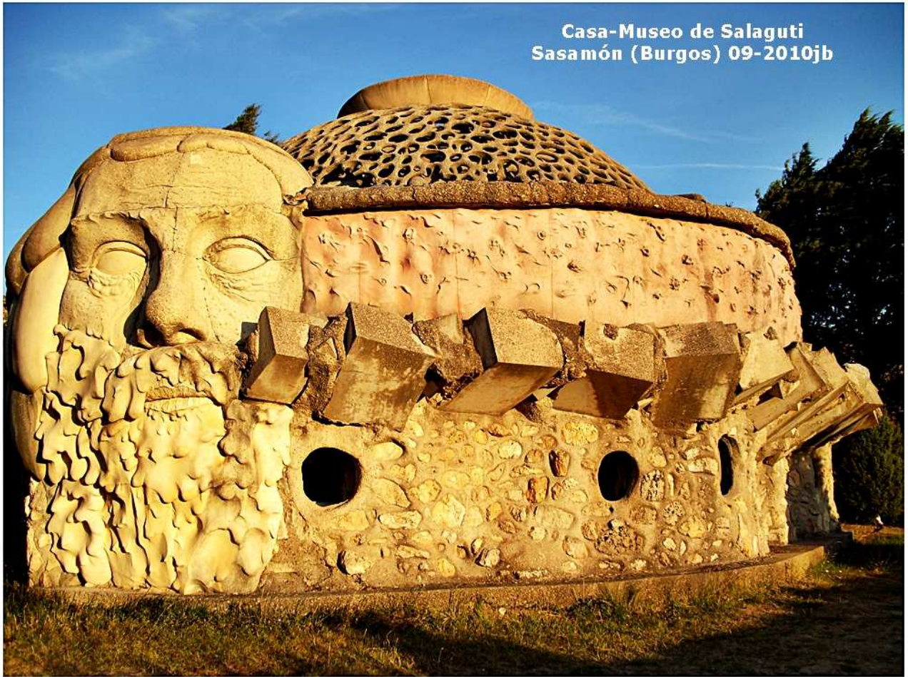
Casa-Museo de Salaguti Sasamón (Burgos) 09-2010jb