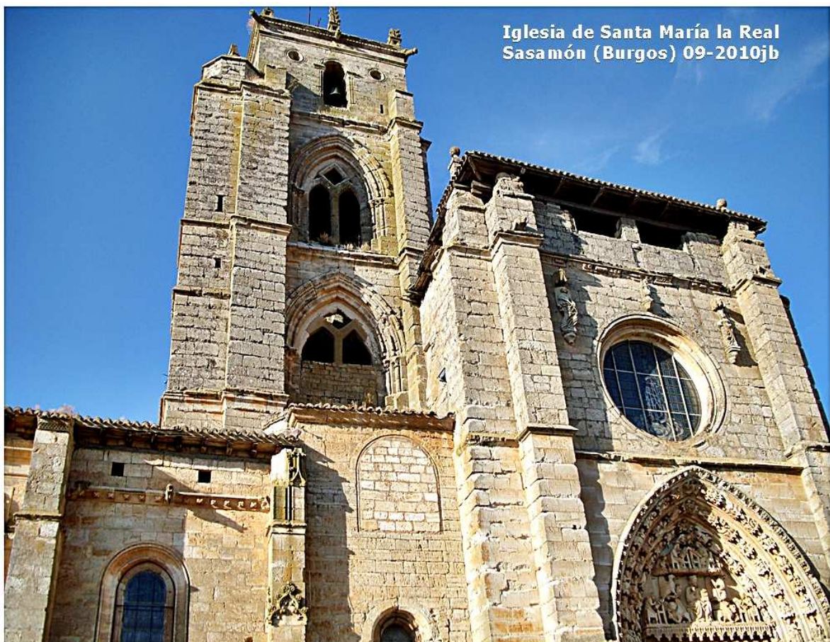
Iglesia de Santa María la Real Sasamón (Burgos) 09-2010jb