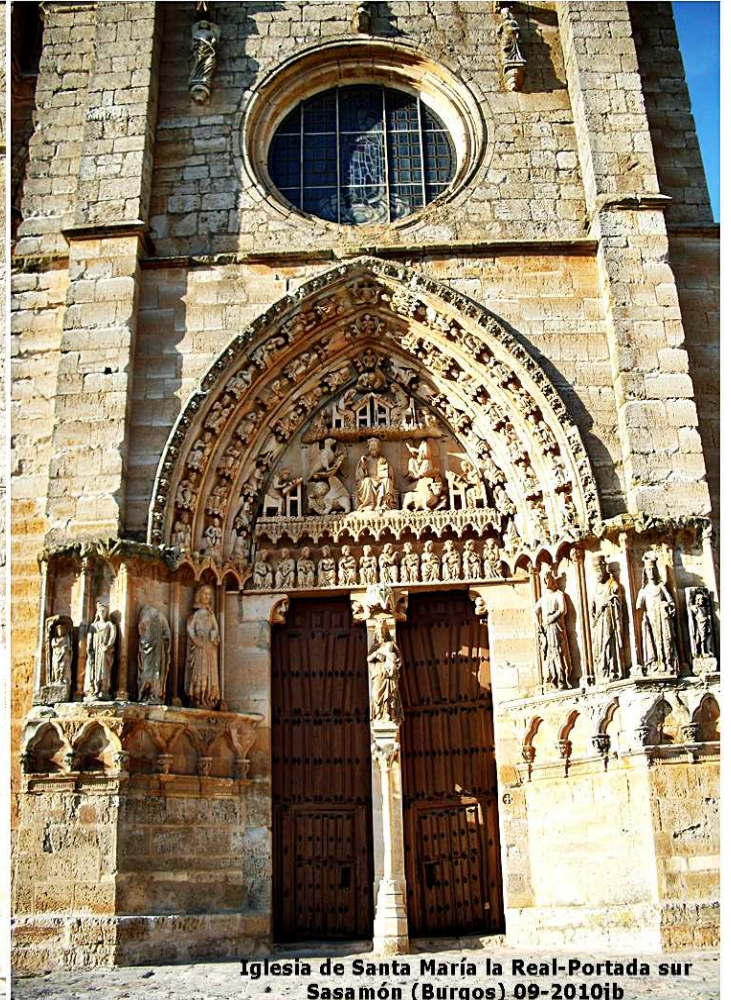
Iglesia de Santa María la Real-Portada sur Sasamón (Burgos) 09-2010jb